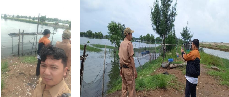
Gambar 3. 2 Monev I terhadap Hibah