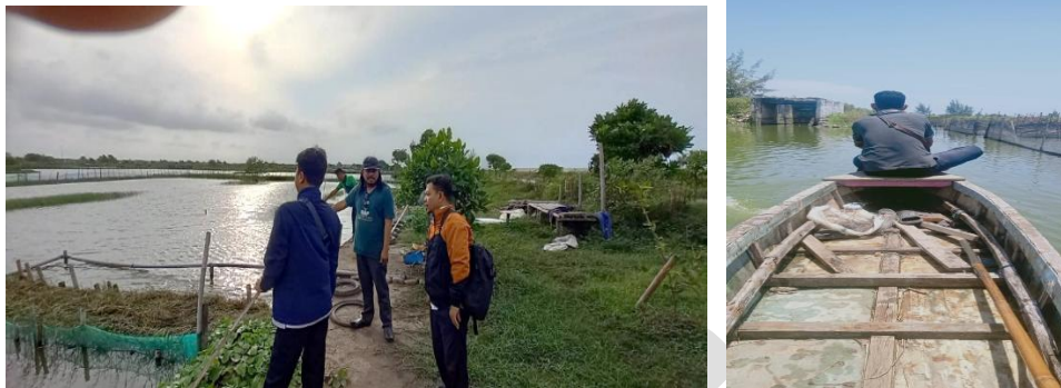
Gambar 3. 3 Monev II terhadap Hibah