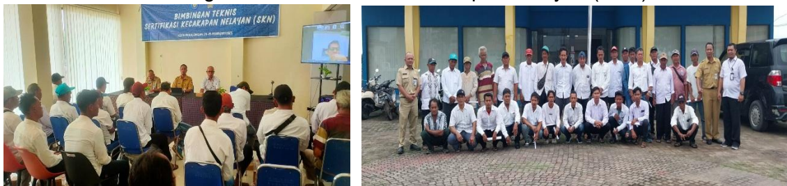
Gambar 3. 4 Bimbingan Teknis Sertifikasi Kecakapan Nelayan (SKN)