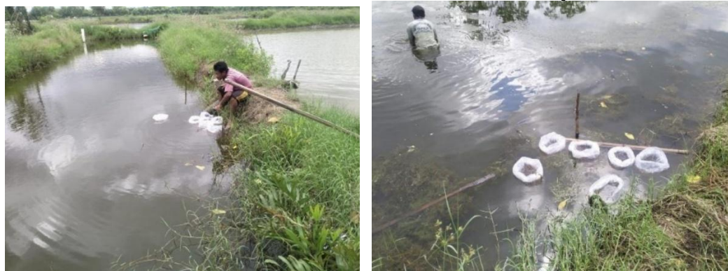
Gambar 3. 1 Penebaran benih ikan untuk Pokdakan Mina Aji

Dilakukan pembinaan dan monitoring setelah mendapatkan bantuan pada tanggal 8 September 2025 dan 7 Oktober 2025.