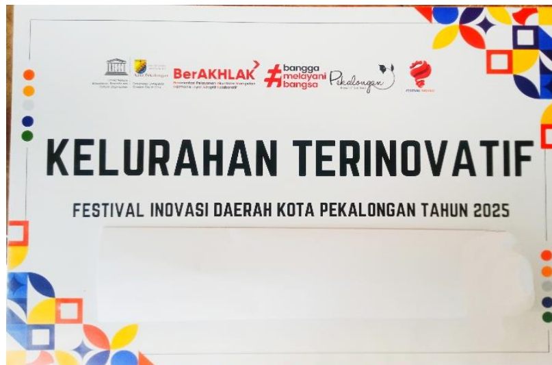
Gambar 3.1 Piagam Penghargaan dalam Festival Inovasi Daerah Kota Pekalongan Tahun 2025

Pada Tahun 2025, Kelurahan Bendankergon yang berada di Kecamatan Pekalongan Barat mendapatkan prestasi yang membanggakan dalam Festival Inovasi Daerah di tingkat Kota Pekalongan sebagai Kelurahan Terinovatif .